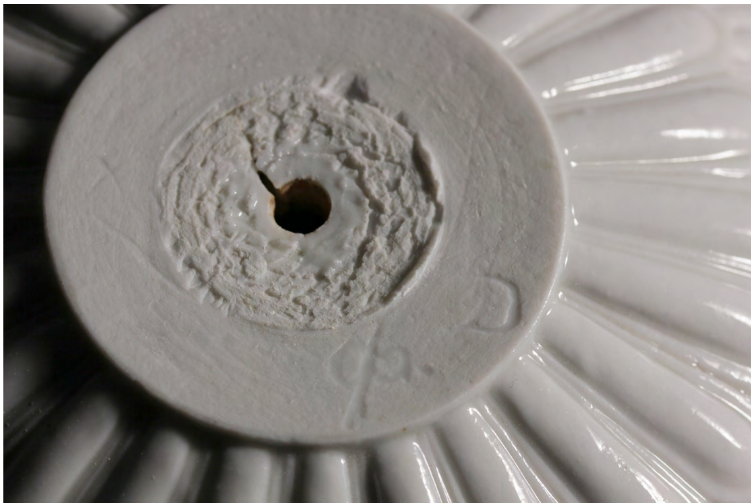
5. Ваза. Метка скульптора-формовщика в тесте — «Ф.Д.». 2017.