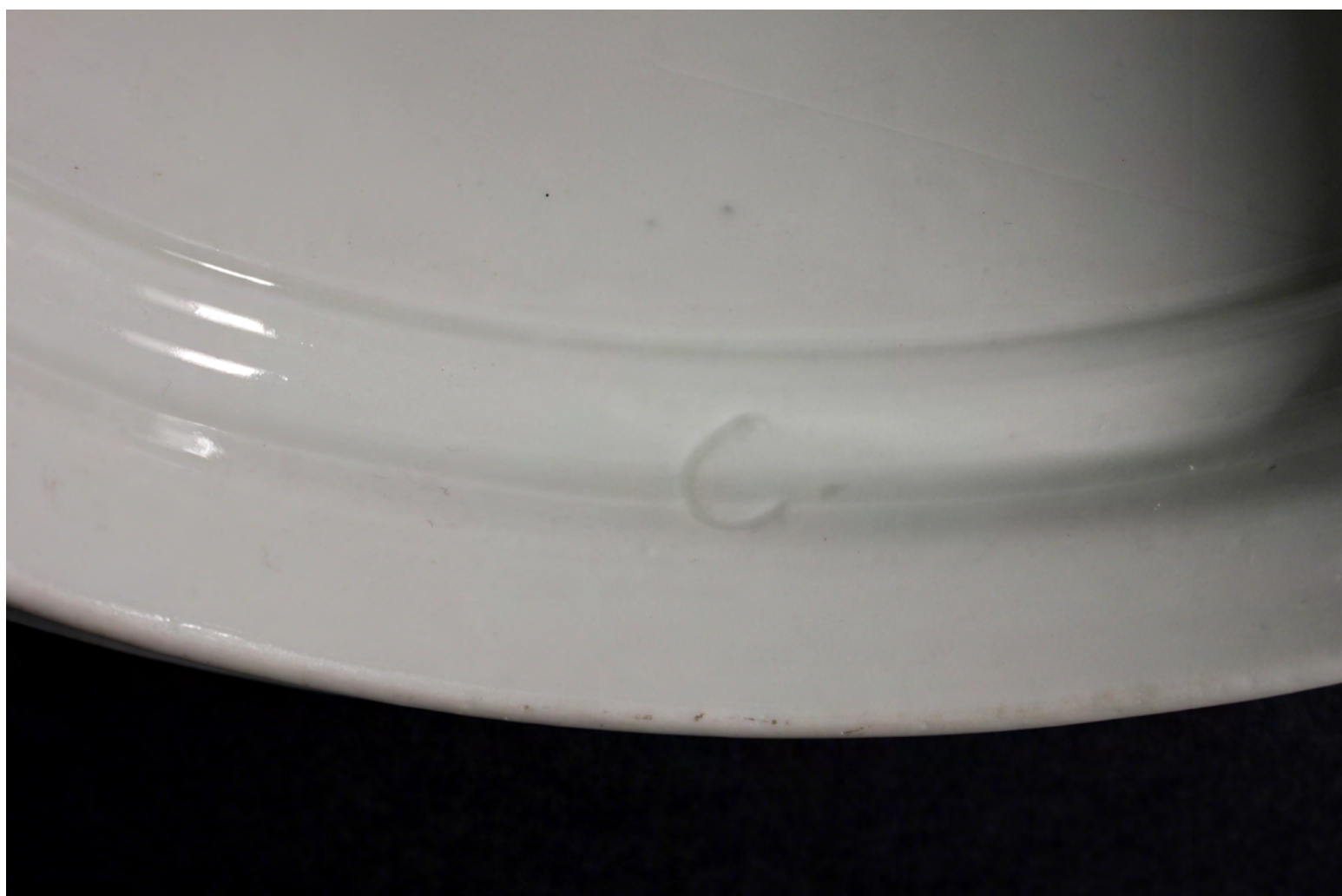
6. Крышка. Метка скульптора-формовщика в тесте — «С.». 2017.