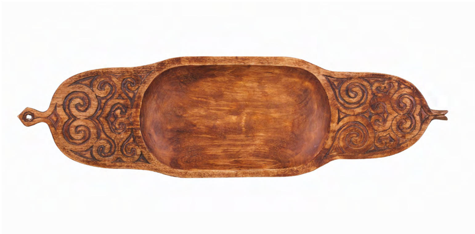
8. В.Я. Ялин. Чаша-корыто. 2000. Село Рыбное, Охинский р-н Сахалинской обл. Дерево, долбление, резьба, тонировка. 3 x 49,3 x 14. Сахалинский областной художественный музей

образов народной культуры в работах современных профессиональных художников. На выставке были представлены произведения сахалинских основоположников «нивхской серии» Гиви Михайловича Манткавы и Владимира Владимировича Тихомирова. Этюды к картине «Нивхские лучники» — «Мальчик-нивх» (ил. 9), «Голова нивха», «Охотник-нивх», которые отличаются «силой и достоверностью проникновения в образы разрабатываемых персонажей картины» [18, с. 97], и гравюрные листы с сюжетно-декоративными композициями из «Нивхской серии», серии «Сакральные знаки» — знакомили посетителей музеев с потомками древнейшей культуры Сахалина.