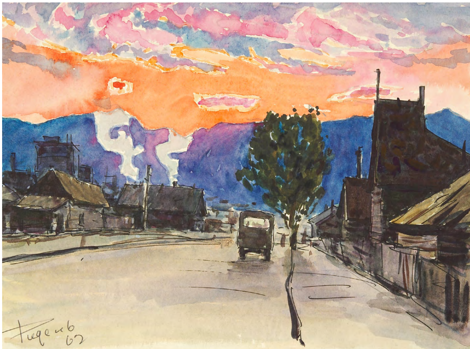
10. В.А. Ридель.