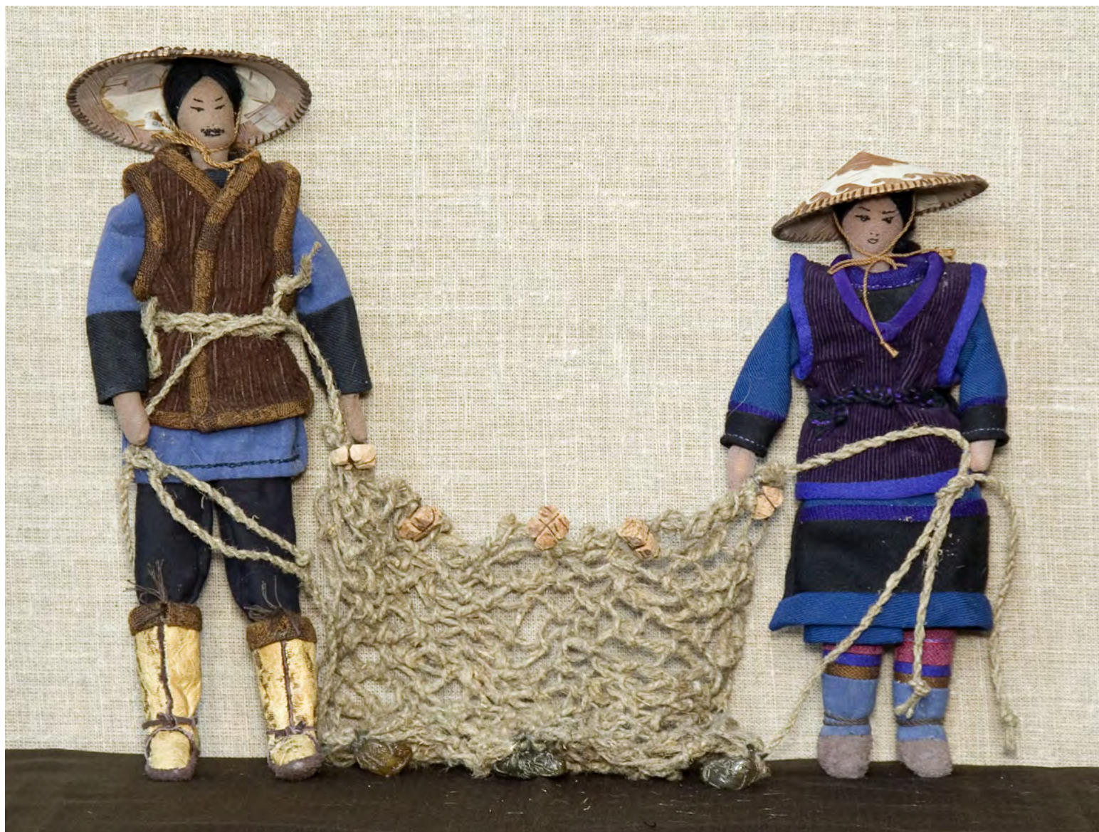
5. Л.Д. Кимова. Композиция «Рыбаки». 2000. Пос. Ноглики Сахалинской обл. Ткань, кожа, береста, пробка, янтарь, аппликация, шитье. 27,5 x 42 x 5. Сахалинский областной художественный музей

Традиционное искусство уильта — феномен оригинальной оленеводческой культуры народа, проживающего в Российской Федерации только на о. Сахалин. По ряду признаков художественная культура уильта близка культуре эвенков. Одновременно с этим прослеживаются некоторые черты искусства народов Амуро-Сахалинского региона. При сходстве в покрое уильтинских и эвенкийских мужских и детских костюмов, женская одежда северных и южных групп уильта отличалась по составу и покрою. На выставке были представлены праздничные костюмы: женский халат южных групп уильта из коллекции Огава Хацуко с покроем, идентичным форме нивхского халата с широкой левой полкой, и комплект Вероники Владимировны Осиповой, воссозданный женщинами северной группы уильта, состоящий из платья, сшитого по типу русской женской рубахи, распространенной у эвенкийских женщин, нагрудника, головного убора и сумочки для рукоделия [16, с. 116] (ил. 6).