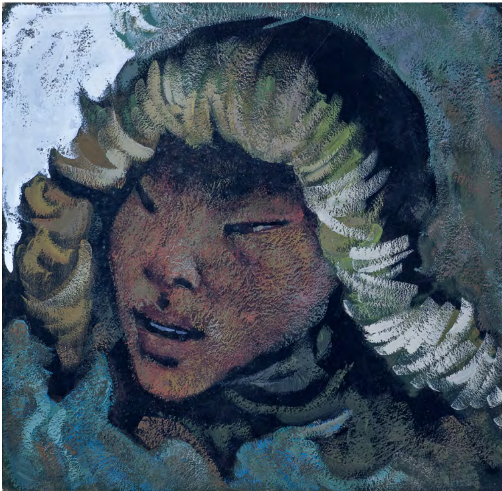
3. Г.М. Манткава.