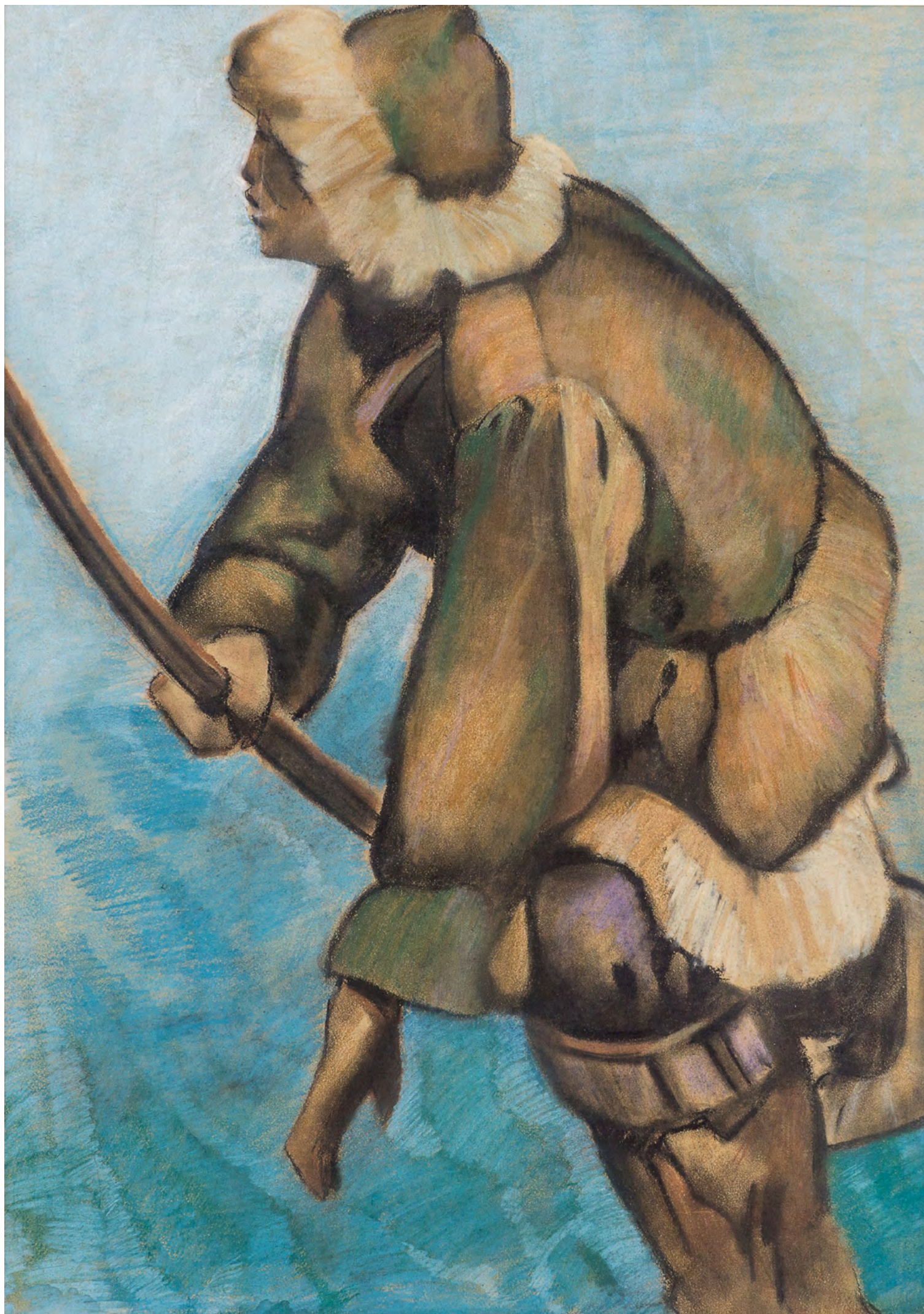
9. Г.М. Манткава. Этюд к композиции «Нивхские лучники». 1970.