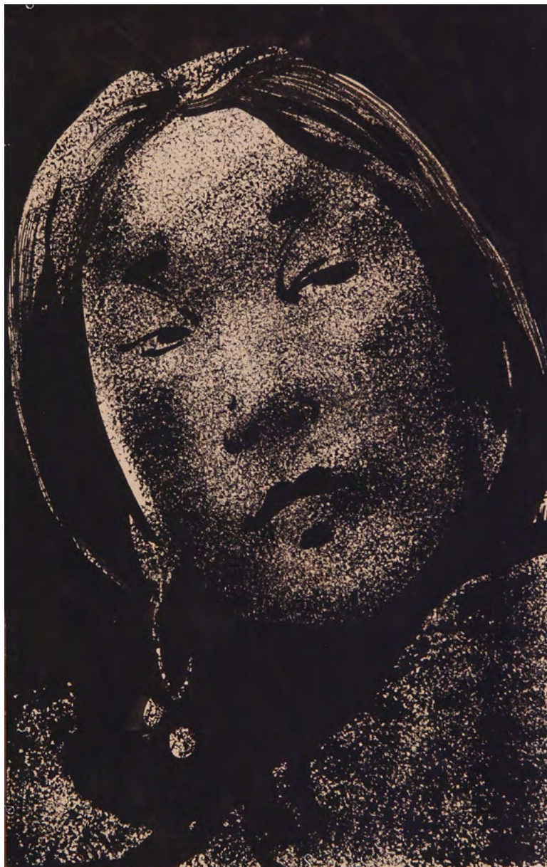
2. Г.М. Манткава. Иллюстрация к повести Владимира Канторовича «Детство нивха Ковгена». 1966. Бумага, тушь. 38,5 x 24. Сахалинский областной художественный музей

работы его известны по «московским изданиям» 6 . Вероятно, интерес Канторовича к произведениям Манткавы способствовал и тому, что художник создал в 1966 году цикл тушевых иллюстраций к написанной в 1937 году повести Владимира Канторовича «Детство нивха Ковгена» (в первой публикации имя героя-нивха писалась с буквой «э» во втором слоге; рис. 2–3).