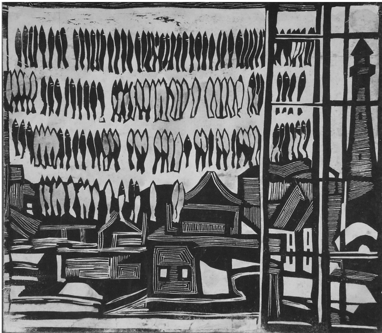
6. Г.М. Манткава. Эскиз к картине «Весенняя корюшка». 1969. Бумага, смешанная техника. 30 x 34,4. Сахалинский областной художественный музей

Акварелью на бумаге изображен читающий книгу поэт, автор популярных эстрадных песен Александр Алшутков (1935–1999). Раскрытая книга, на страницы которой смотрит герой картины, — это часть художественного сюжета. Образ книги интересен и в этом портрете, и в других работах художника, нередко обращавшегося к изображению книг как деталей пространства, как, например, в картине «Зеленый абажур» (1975).