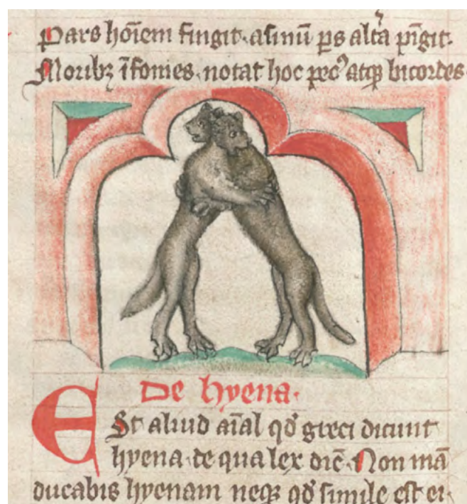
4. Миниатюра к главе о гиене из bestiaria аббатства Альдерсбах.