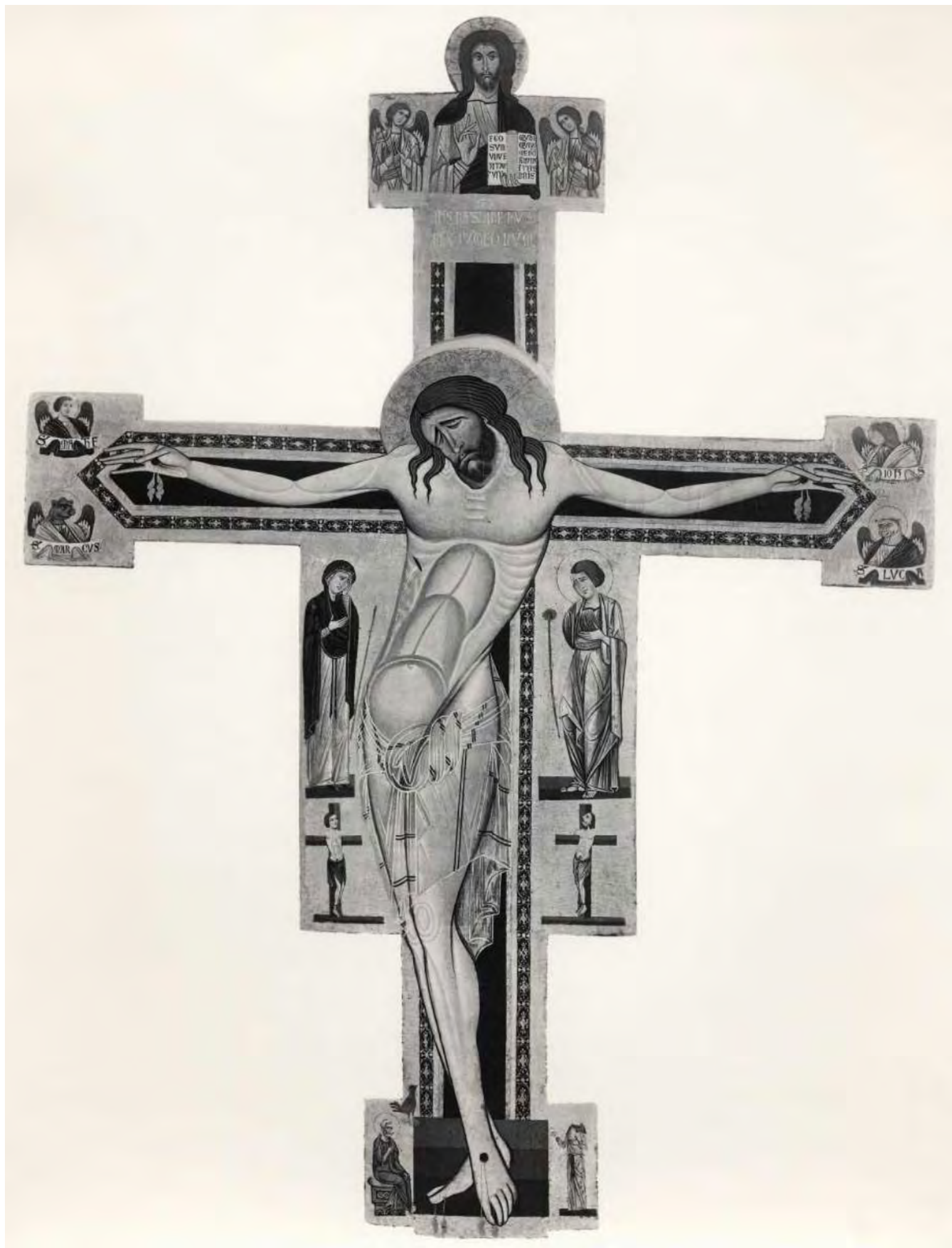
Фото: Фонд Федерико Зери, инв. 8562, catalogo. fondazionezeri.unibo.it

Комплекс бывшего монастыря облатов, Флоренция.