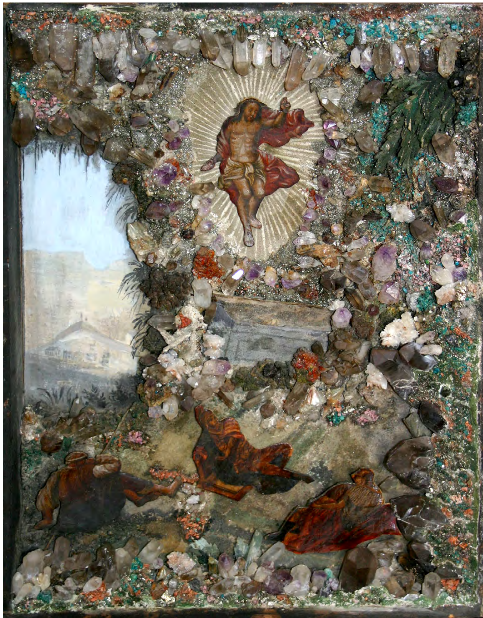
3. Мастерская А.К. Денисова- Уральского (?). Воскресение христово со стражниками.