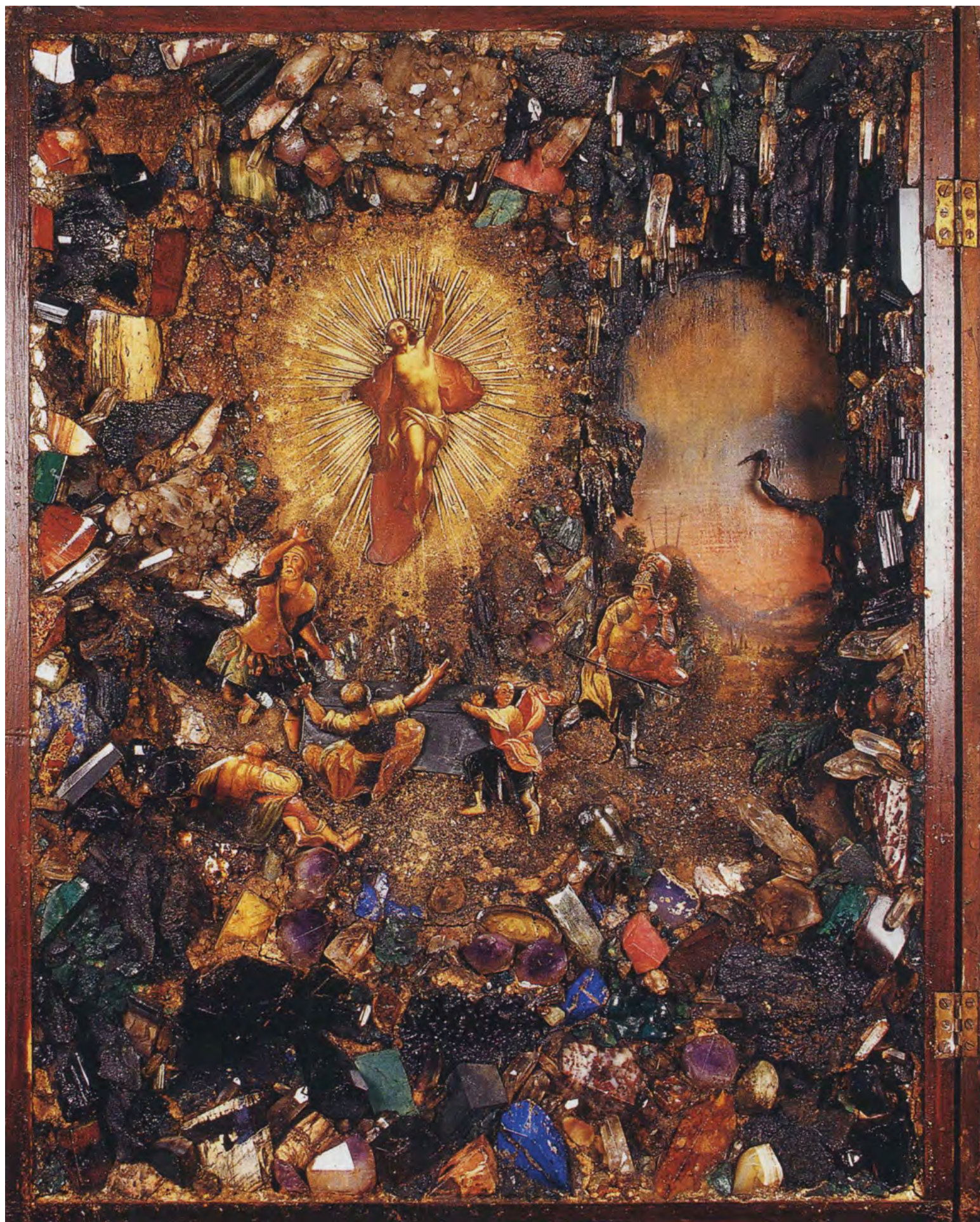
2. Мастерская А.К. Денисова- Уральского (?). Воскресение Христова со стражниками. XIX в. Поделочные камни, живопись, дерево. Частная коллекция, Екатеринбург. Фото: [5]