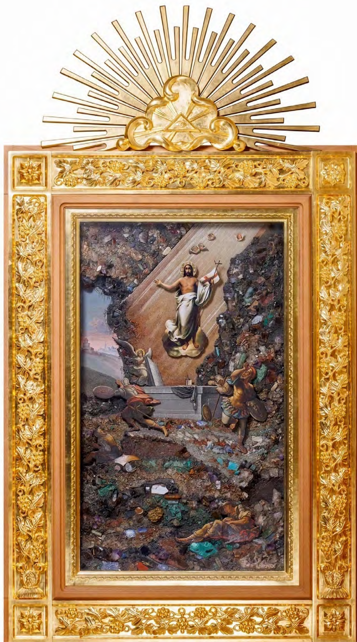
1. Н.Н. Бушуев. Воскресение Христово со стражниками. 1826.

Поделочные камни, живопись, дерево. Горный музей Санкт-Петербургского горного университета.