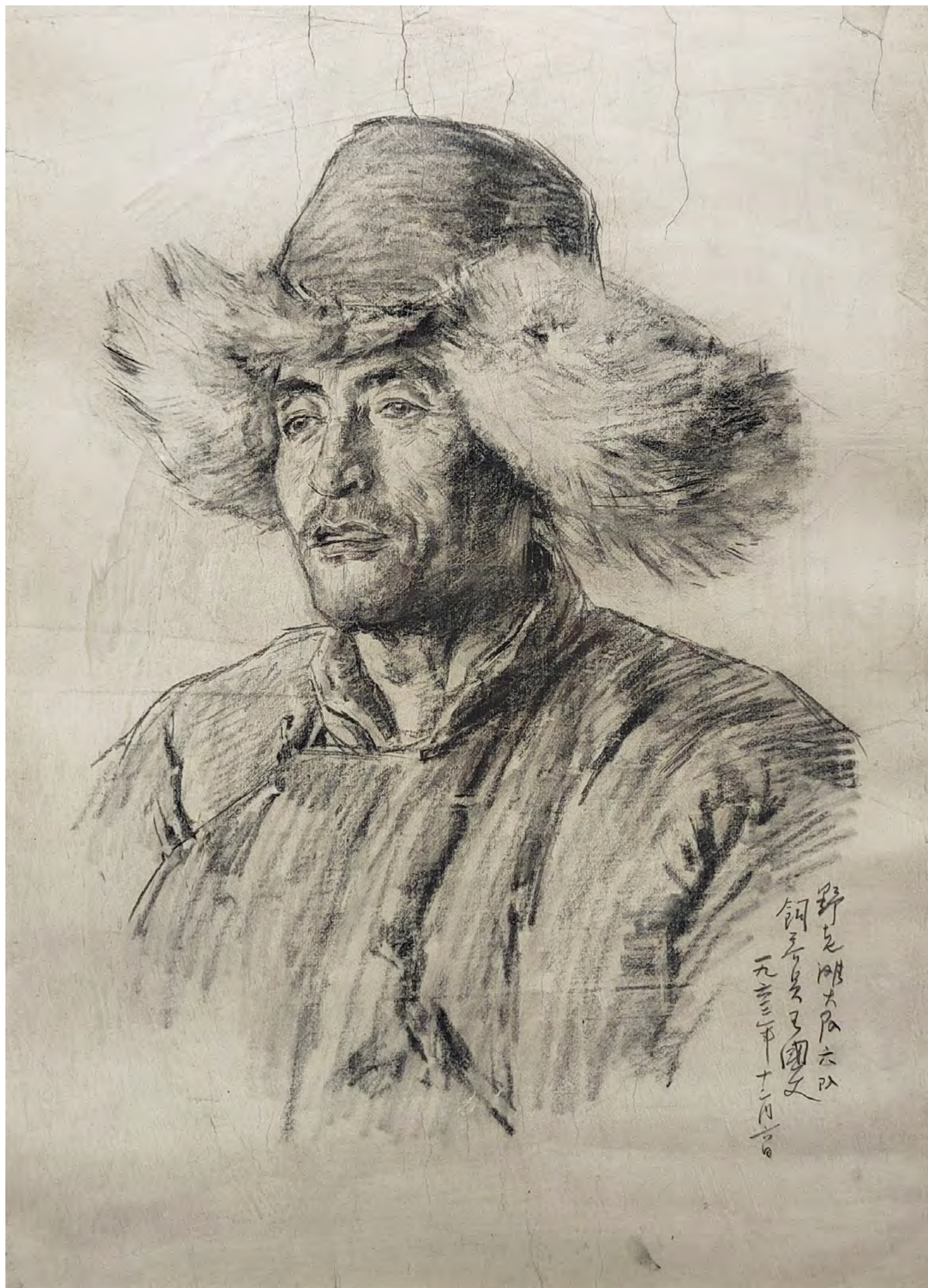
4. Ван Шэнле. Скотник Ван Говэнь. 1963. Бумага, карандаш. 50 x 35.