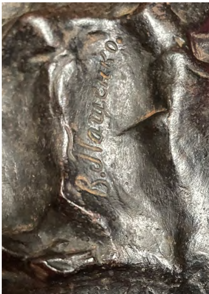
15. Авторская подпись «В. Пащенко, СПб. 1898 г.»

на памятнике-бюсте композитору М.И. Глинке в г. Санкт-Петербурге.