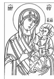
Тип иконы Богородичного цикла «Одигитрия»

К этому типу относятся иконы «Смоленская», «Казанская» и многие другие иконы Богородицы.