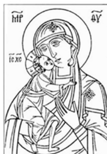
Тип иконы Богородичного цикла «Елеуса»

К этому типу принадлежат «Владимирская», «Толгская» и др. иконы.