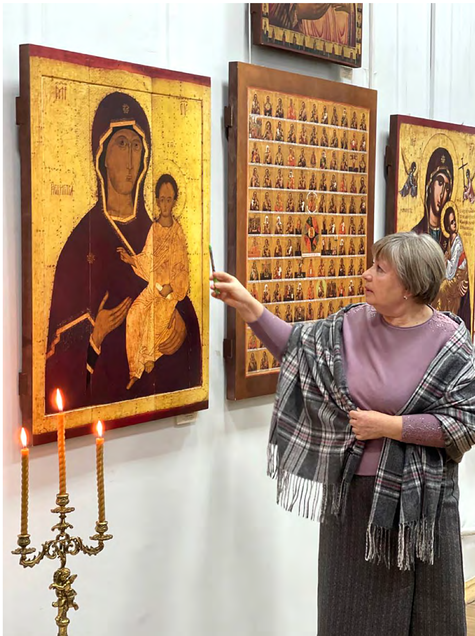
5. Экскурсия в зале передвижной выставки «Образ Богородицы. Иконы XVI–XIX веков». Проект «Наши традиции», 2022.