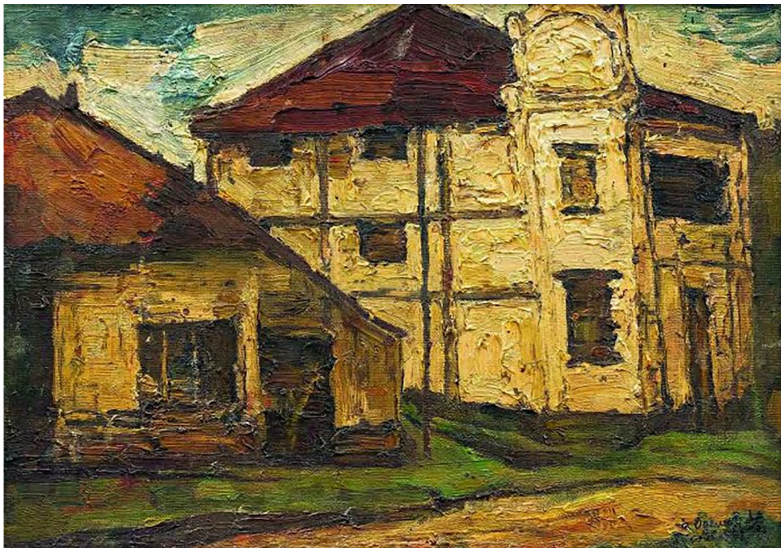
8. У Гуаньчжун. Парижский пейзаж. 1947. Картон, масло. 28 x 50.

Дюпа, У Гуаньчжун переводится через год в класс профессора Жана Суверби (Jean Souverbie, 1891–1981, рис. 9), имевшего большую известность и признание в европейских кругах. Он был гуманистом франко-латинской традиции, в то же время отразив в своем творчестве приверженность авангардному художественному движению (фовизм, кубизм).