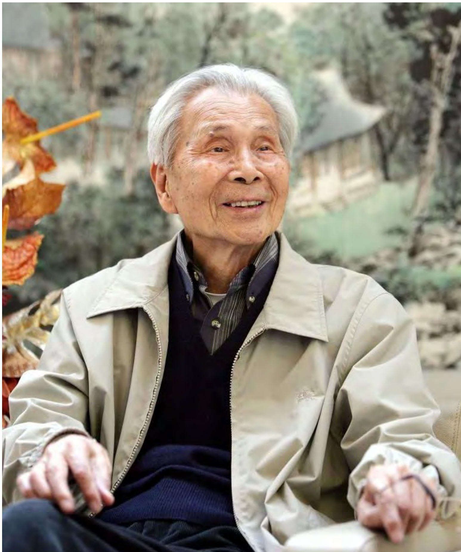
1. У Гауньчун.