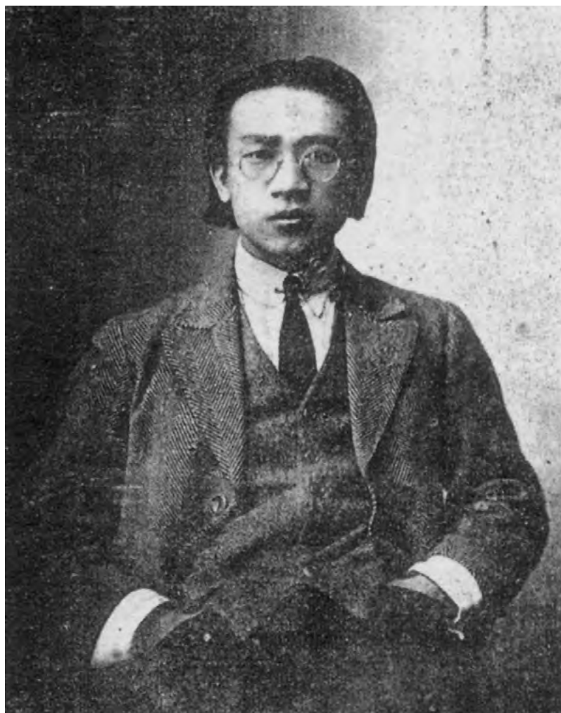
3. Цай Юаньпэй.