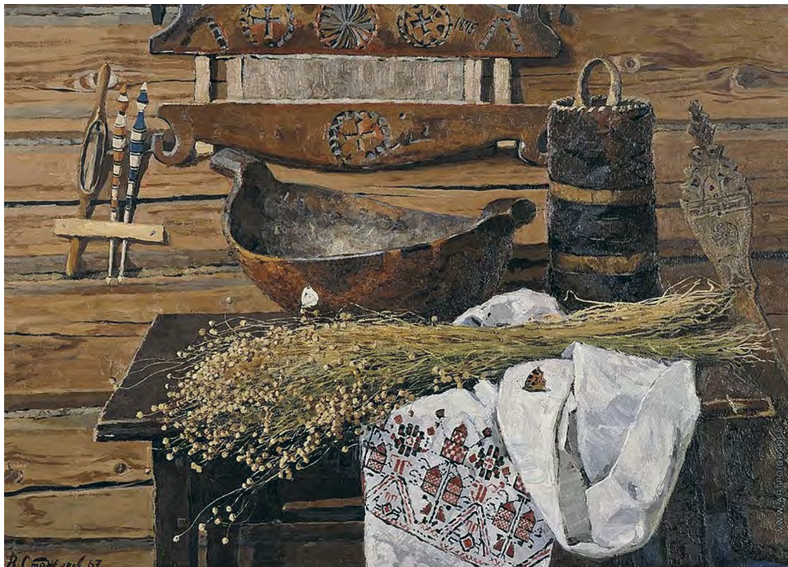
Или Дарисовна Стогова: Чья эта муха?