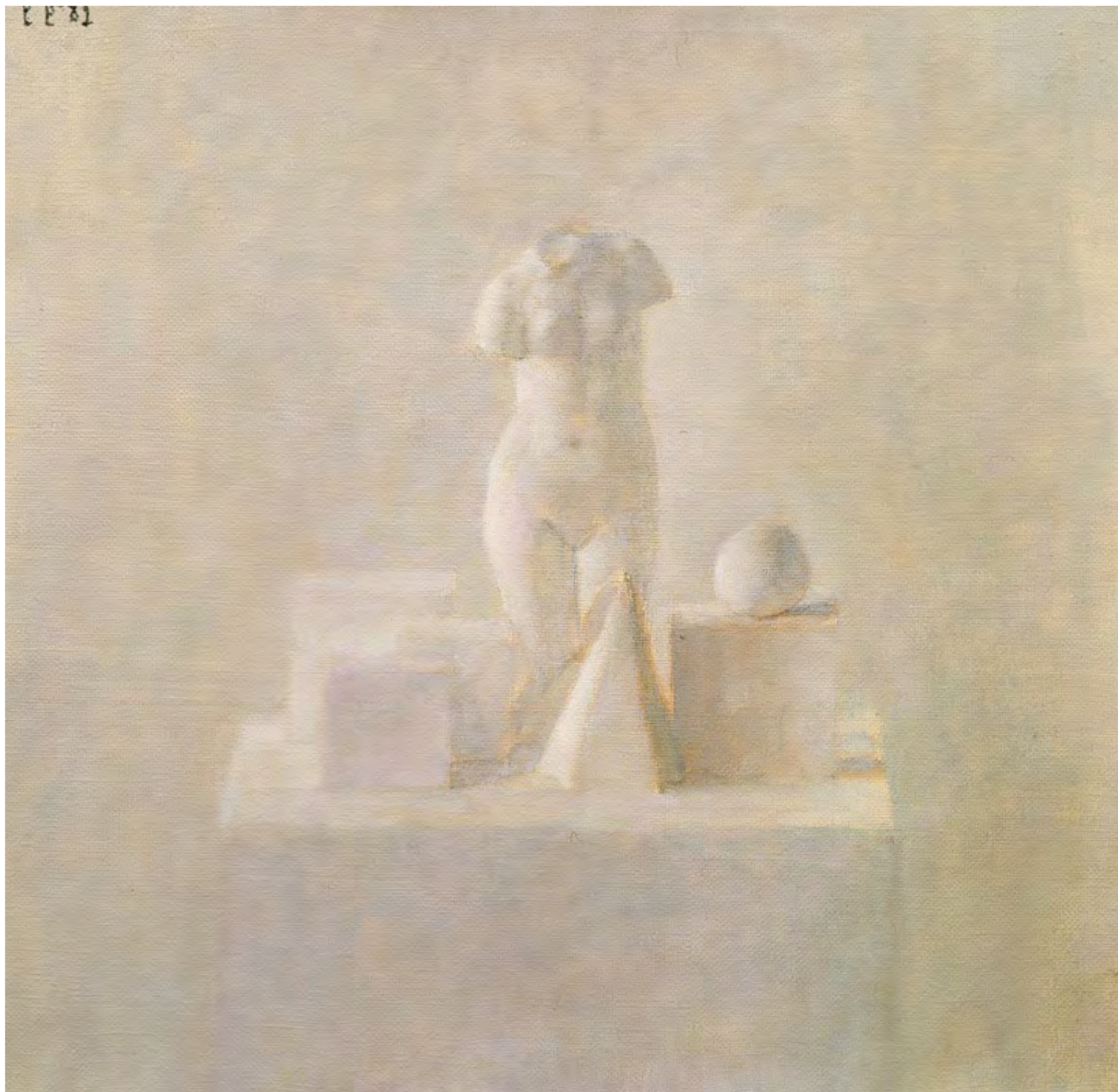
7. В.Г. Вейсберг. Большая Венера, кубы и шар. 1983. Холст, масло. 53 x 49. Государственная Третьяковская галерея.

мелкими шажками, чтобы добиться гармонии единства среды и предмета, в нее помещенного.