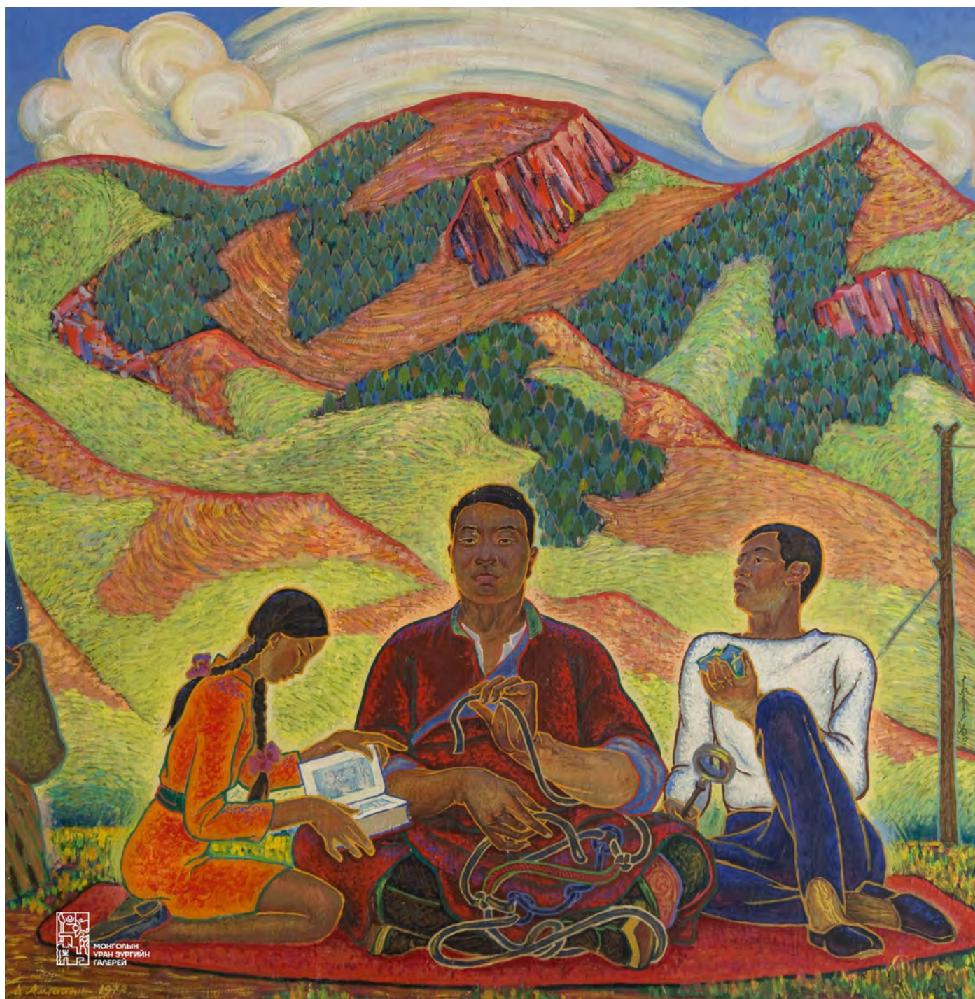
4. Д. Амгалан. Хозяева Родины.

Национальная художественная галерея Монголии, Улан-Батор