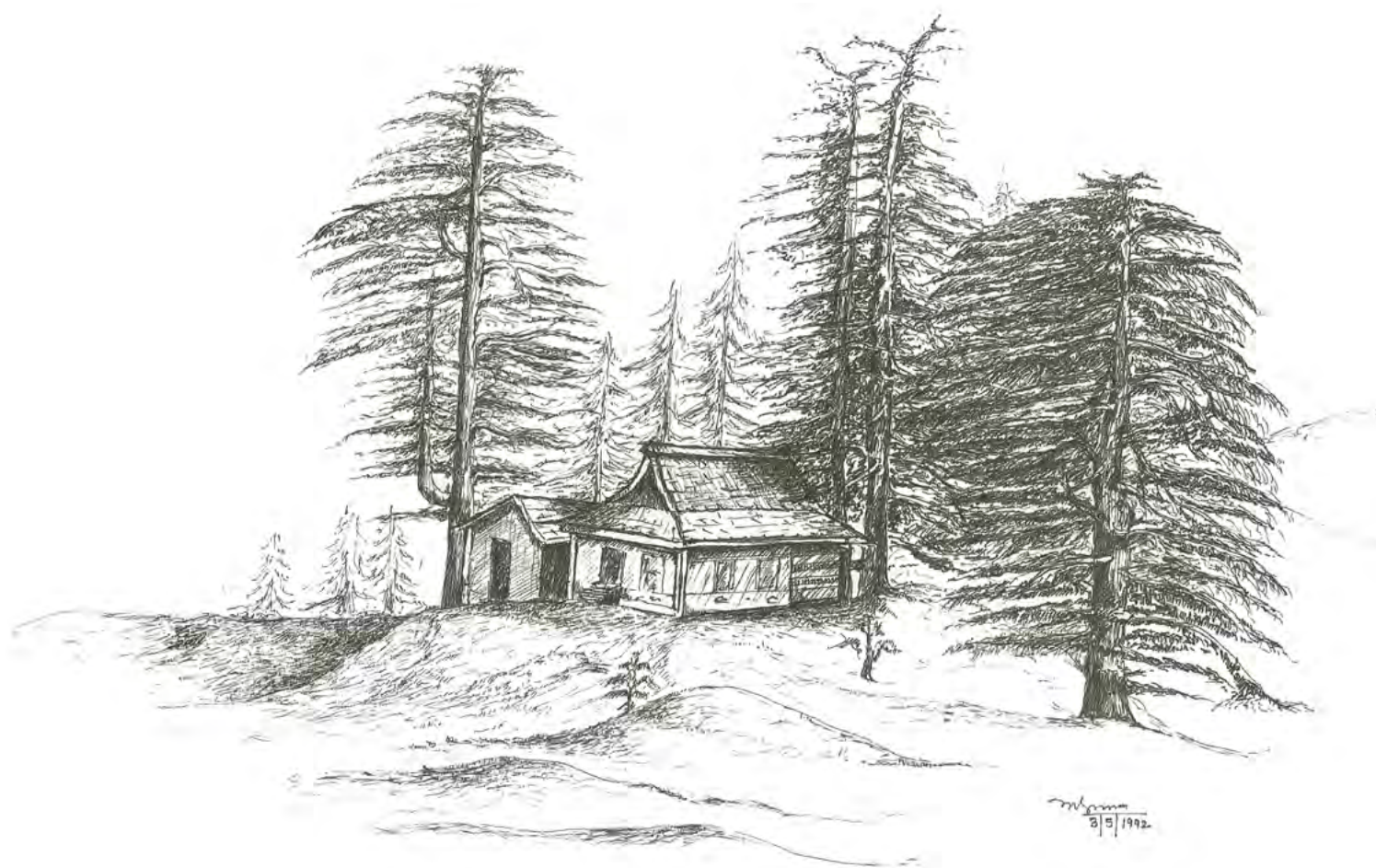
2. О.Ч. Ханда. Храм Нага в Налдехре [10, с. 18]